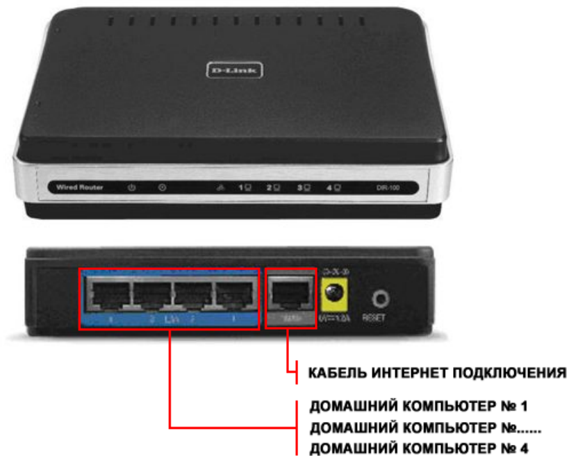
Рис. 1 Маршрутизатор D-Link DIR-100.